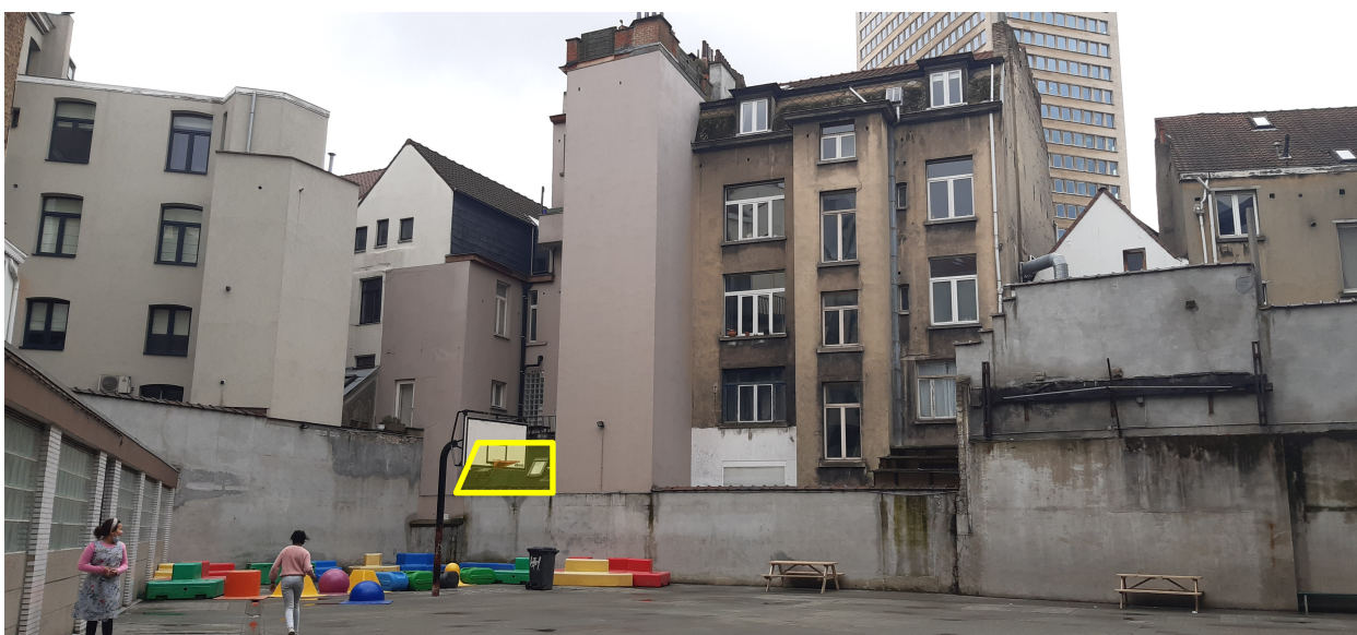
BIJLAGE 3: Door de Huurder genomen foto van de toekomstige plaatsing